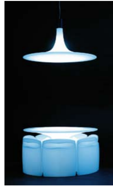
▲ De serie 'Bronco Corral' van Extremis bestaat uit meubilair met verlichting van binnenuit; meerdere kleuren mogelijk