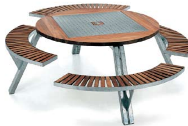
▲ Multifunctioneel en weersbestendig; Gargantua

Op Danskinashop.nl vindt de sitebezoeker een uitgebreide collectie tapijten en meer achtergrondinformatie over Danskina. Het assortiment van Extremis (zeer exclusief meubilair en accessoires voor binnen en buiten