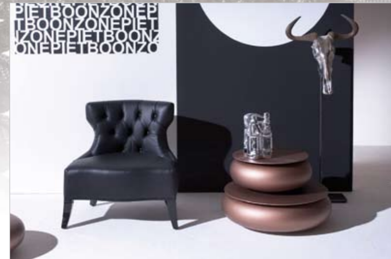
▲ Piet Boon; 100 % Dutch Design

Aanvullende informatie: Guy Sarlemijn Interior Design Netwerk 136 1446 WR Purmerend Tel. (0299) 463313 www.designlabels.nl