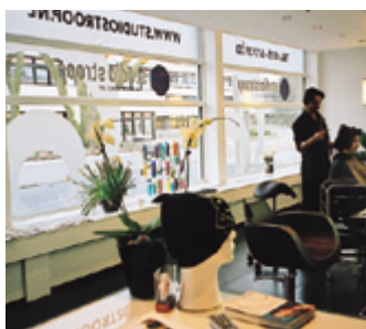
Het voorste deel van de studio.