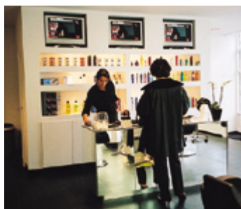
Mooi, die balie en de producten erachter.